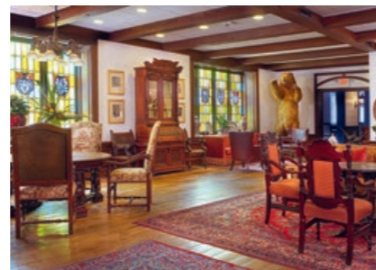
Fast ein englisches Landhotel: The Cheshire in St. Louis.

Benpool. Das Cheshire, das 2011 für mehrere Millionen Dollar renoviert wurde, hat zweifellos Stil. Jedes der 108 Zimmer ist einem berühmten Schriftsteller gewidmet, darunter sechs außergewöhnlich gestaltete Suiten zu Themen wie „James Bond“, „Romeo & Julia“ und E. M. Forsters „Passage to India“. ab