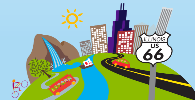
Info-Karte 17 ankreuzen