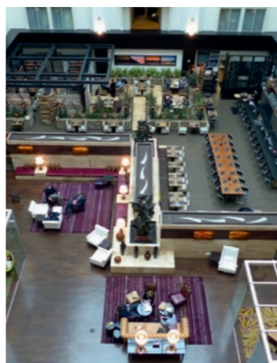
Nostalgisch-modern: das Nines in Portland.

tel wie diesem selbstverständlich. In der obersten Etage befindet sich das Departure Restaurant, in dem moderne asiatische Kochkunst zelebriert wird. mb/pk