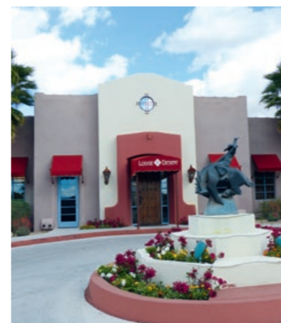
Hacienda-Feeling mitten in Tucson.