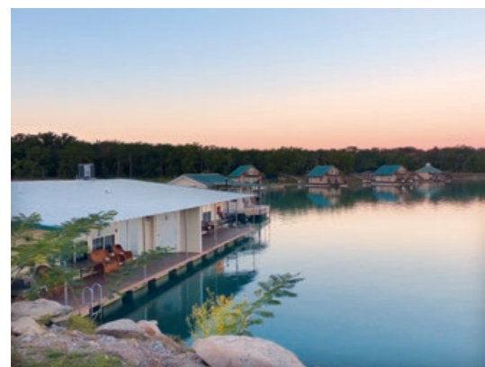
Hotelboote auf dem Lake Murray.

Lodge on the Desert , 306 N. Alvernon Way, Tucson, AZ, Tel. +1 (520) 320-2000, DZ ab $90, www.lodgeonthedesert.com